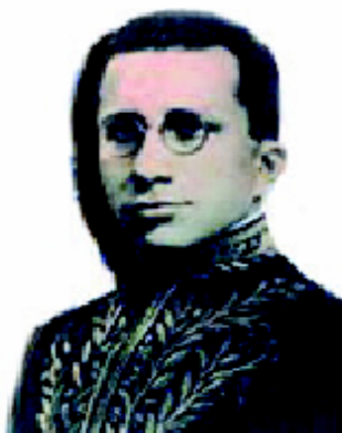
Humberto de Campos (Seudónimo Hermano X) Famoso periodista y escritor, miembro de la renombrada Academia Brasileña de Letras. Escribió doce libros a través del médium Francisco Cândido Xavier - Chico Xavier, narrando espectaculares reportajes del Más Allá.

Acabando Cristo de hablar, Simón Pedro calló y se entregó a meditar.