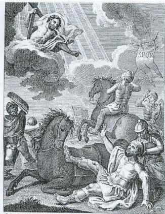
Verdadero Retrato de la Conversión del Apóstol. S. Pablo, que se convertió en su Hermita, sita en los términos de la Villa de Apamea, según Alejandro para los Indios, de un viaje y aflicción. Celebró la fiesta en esta Hermita el día 25 de Enero. Revuelto en P. N. An. Meno. (Quinta vez) de la Biblia de los Santos. (Segunda vez) de la Biblia de los Santos. (Tercera vez) de la Biblia de los Santos. (Cuarta vez) de la Biblia de los Santos. (Quinta vez) de la Biblia de los Santos. A expensas de un devoto del año 1808. G. B. B. B. B.

Después de tres días la pequeña caravana salió de Jerusalén para la extensa planicie de Siria.